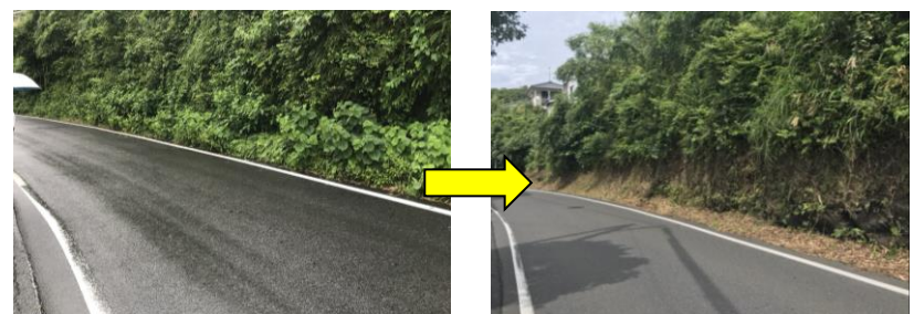
県道19号線の雑草もきれいに刈り取られました。