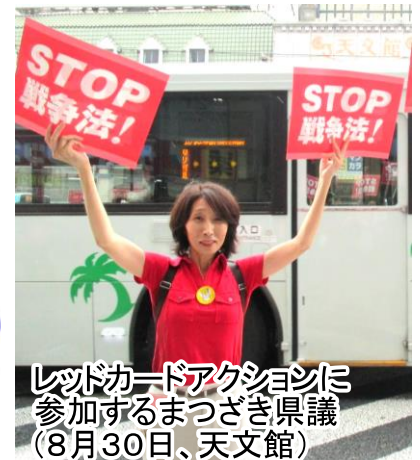
レッドカードアクションに参加するまつざき県議（8月30日、天文館）

9月議会で一般質問を行います。傍聴にお越しく下さい。 9月25日(金)10時より県議会7階 主な質問内容は、後日お知らせします