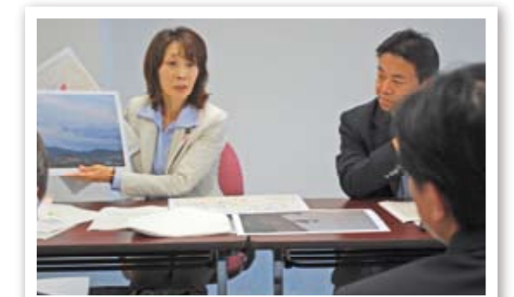
米軍機の低空飛行問題で県に申し入れ(12月28日)