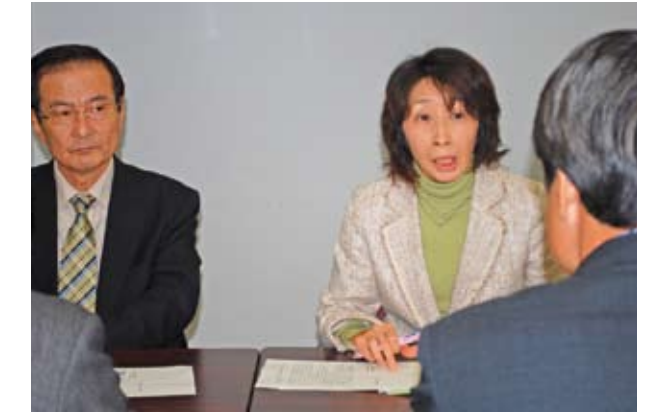
知事に申し入れを行う。(1月29日)