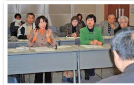
川内原発定期点検事故について九州電力に申し入れ(2月4日、九州電力鹿児島支店)