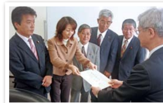
さとうきびの価格保障について農林水産省と交渉(11月5日、参議院議員会館)