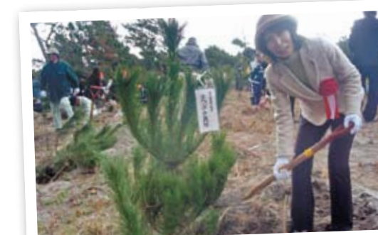
鹿児島地域植樹祭で松の苗を植樹(2月13日、いちき串木野市)