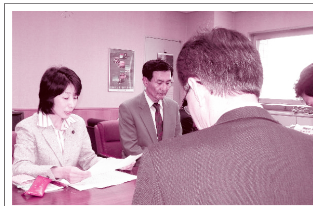
鹿屋基地の米軍訓練基地化に反対する申し入れ