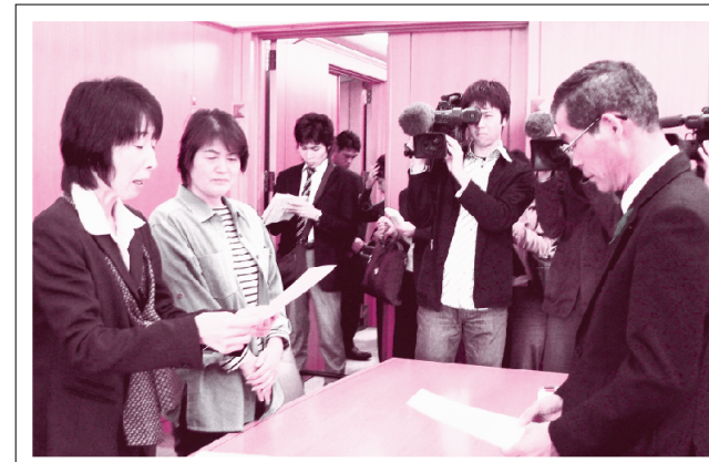
県庁東側の土地購入中止を求める署名を提出する