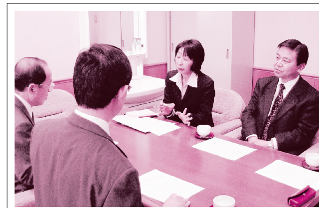
いわさきグループのバス路線廃止問題の対策について県に申し入れ