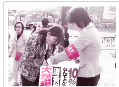
消費税増税反対の署名活動