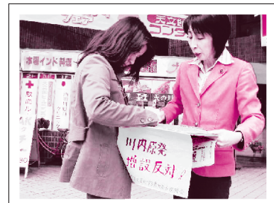
川内原発増設反対の署名活動