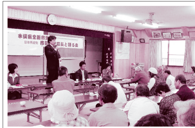
市田書記局長や仁比参議員議員とともに水俣病患者さんとの懇談会に参加